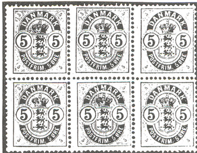
Tryk 3, nr. 36-48 (nr. 47 med streg over M).